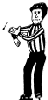
Slag på kølle