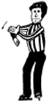
Slag på kølle