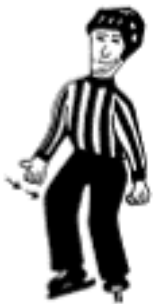
Slag på skøyter