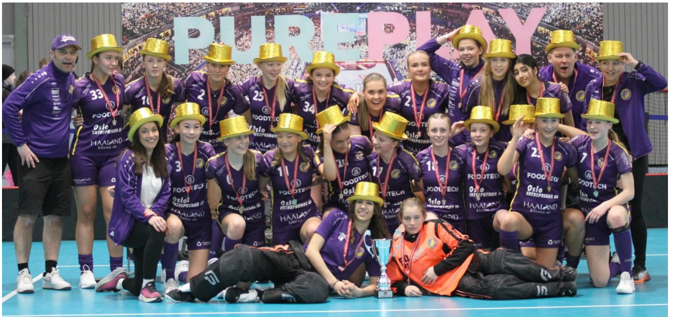
Tunet IBK ble Norgesmestere for J15 sesongen 2022/23.