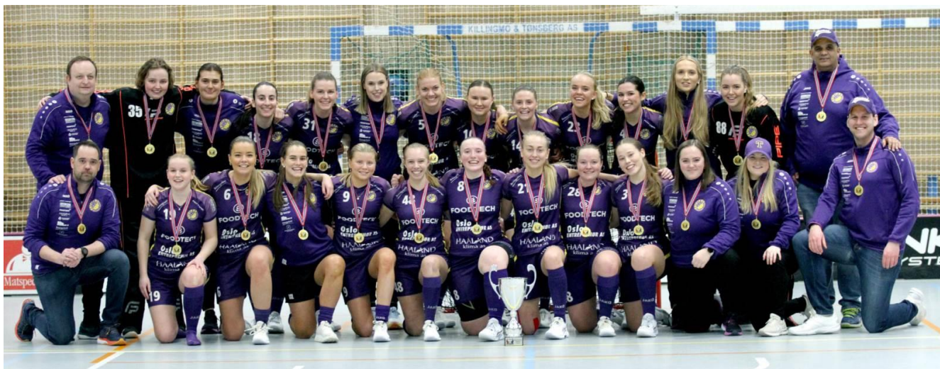
Tunet IBK ble eliteseriemestere for kvinner sesongen 2022/23.