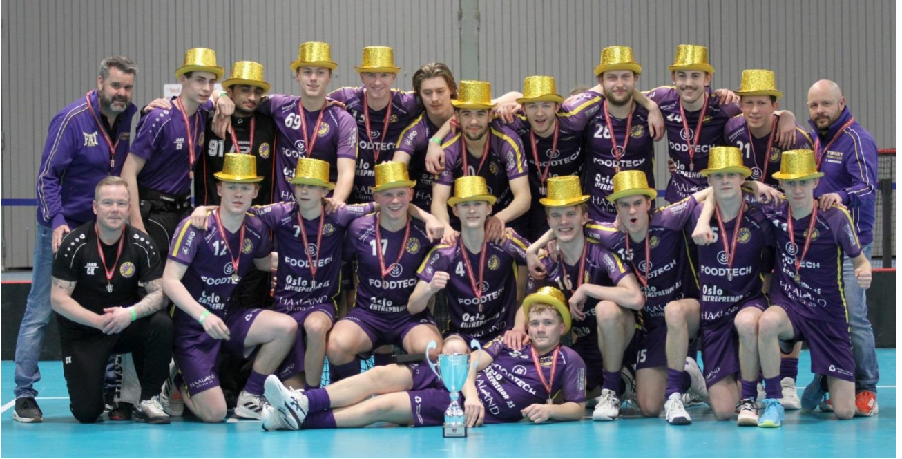
Tunet IBK ble Norgesmestere for G19 sesongen 2022/23.