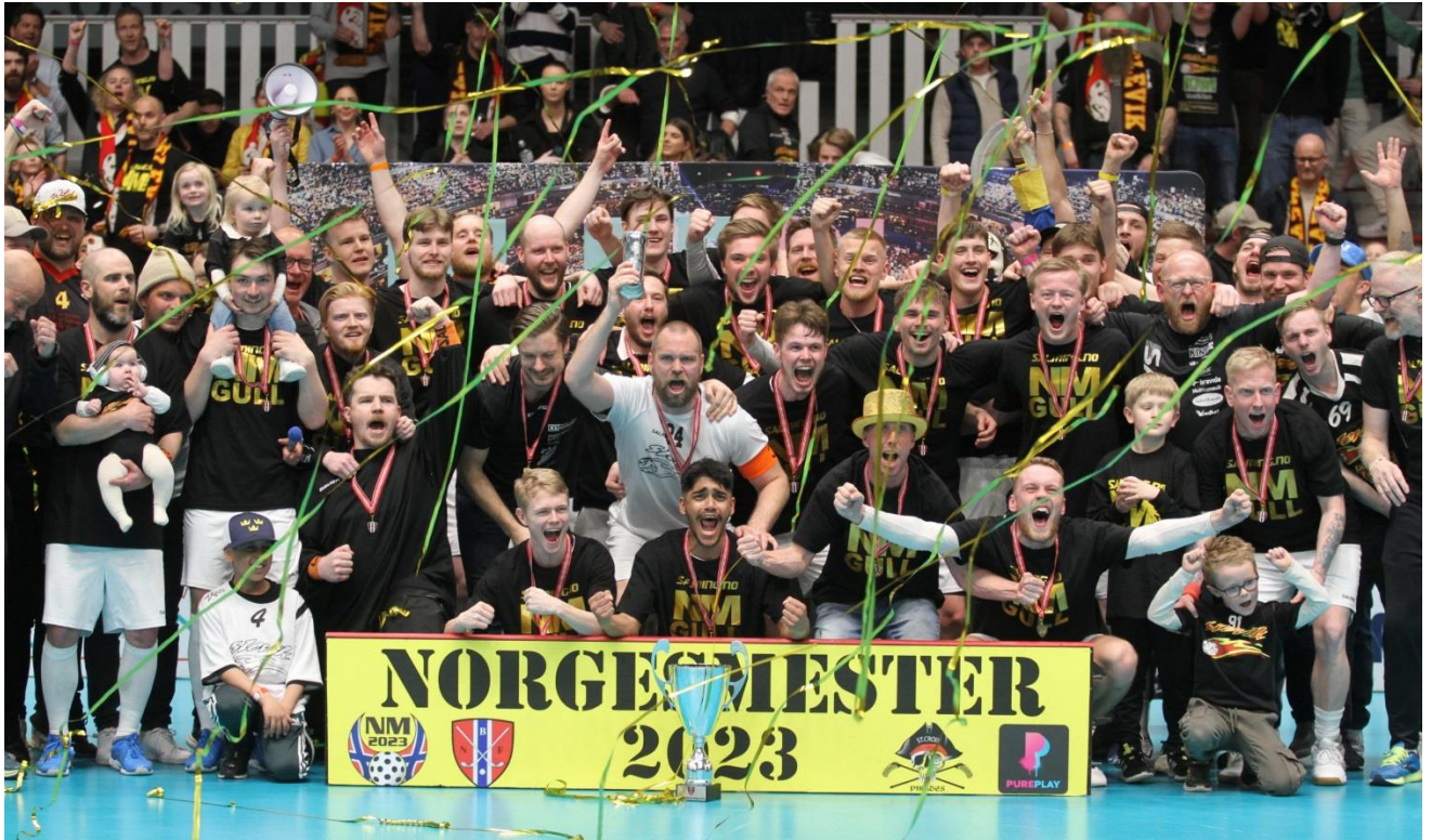
Slevik IBK ble Norgesmestere for menn sesongen 2022/23.