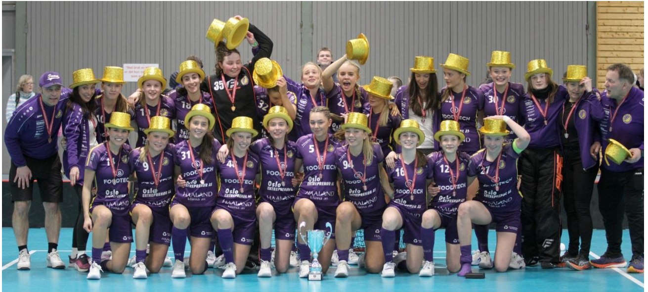
Tunet IBK ble Norgesmestere for J19 sesongen 2022/23.