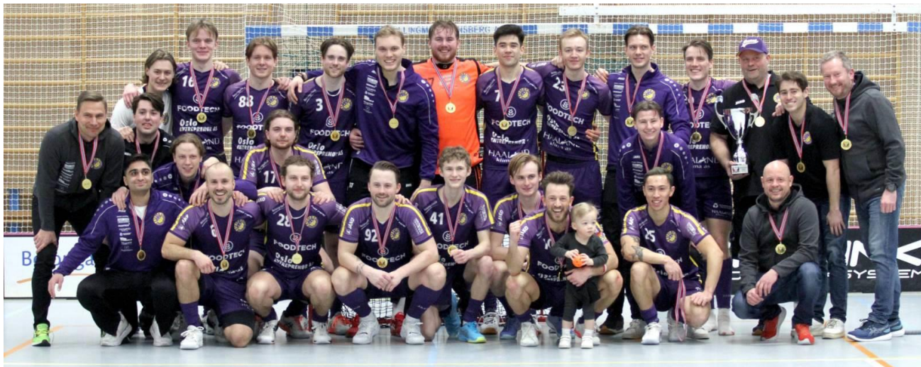
Tunet IBK ble eliteseriemestere for menn sesongen 2022/23.