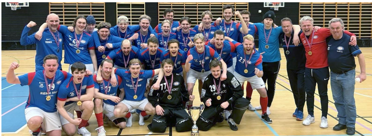
Vålerenga IF ble seriemestere for 1. div østland menn sesongen 2022/23.