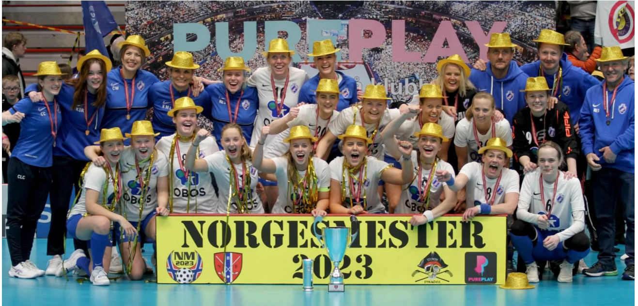
SF Grei ble Norgesmestere for kvinner sesongen 2022/23.