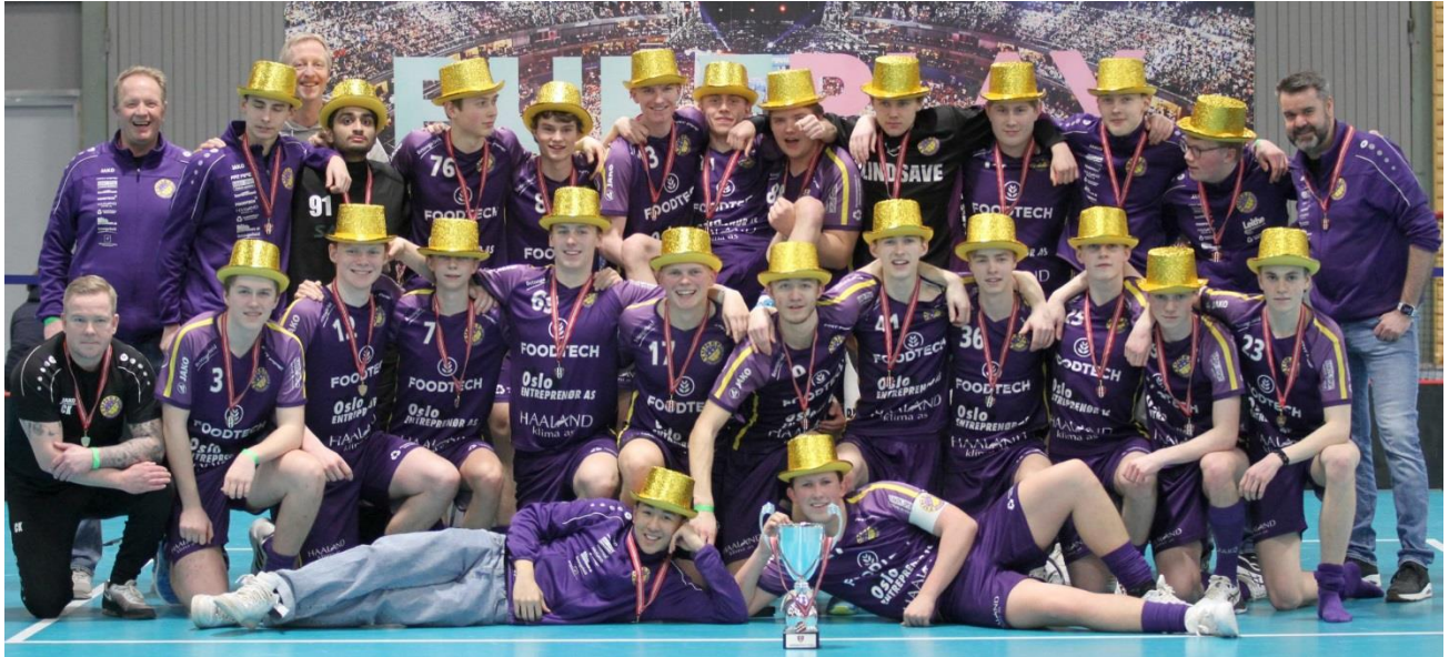
Tunet IBK ble Norgesmestere for G17 sesongen 2022/23.