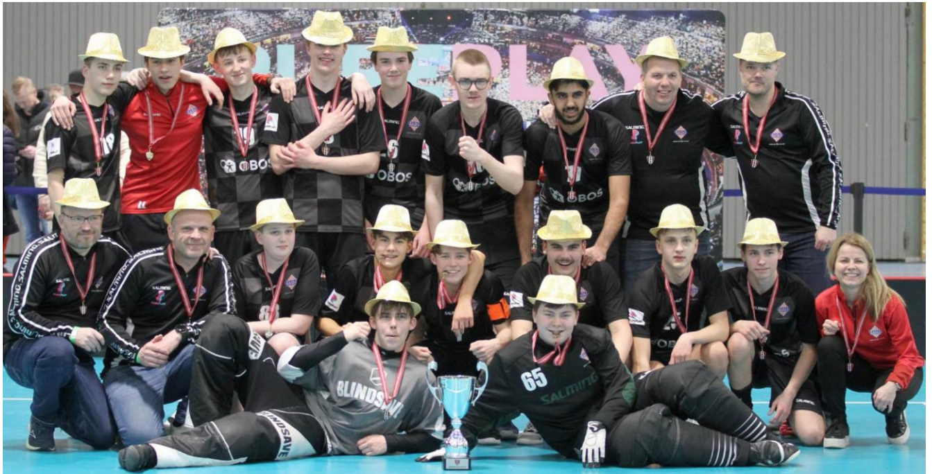
Sveiva IB ble Norgesmestere for G15 sesongen 2022/23.

04 Tunet - Nittedal 2- 7 05 Østensjø - Hommersåk 5- 2 06 Fjerdingby - Sandnes 2- 4 10 Nittedal - Østensjø 10- 3 11 Hommersåk - Fjerdingby 5-14 12 Sandnes - Tunet 0-12 16 Fjerdingby - Nittedal 3- 5 17 Tunet - Østensjø 3- 2 18 Hommersåk - Sandnes 0- 6 22 Tunet - Fjerdingby 8- 2 23 Nittedal - Hommersåk 16- 0 24 Østensjø - Sandnes 2- 1 28 Hommersåk - Tunet 0-19 29 Fjerdingby - Østensjø 2- 0 30 Sandnes - Nittedal 1- 9