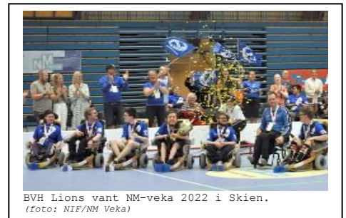
BVH Lions vant NM-veka 2022 i Skien.