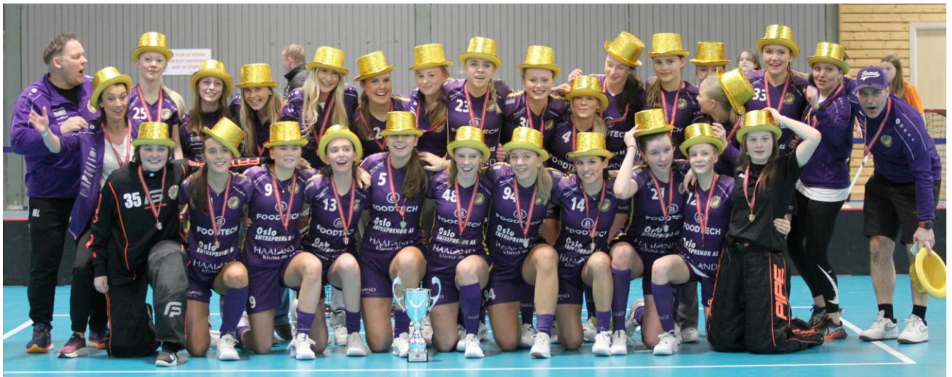
Tunet IBK ble Norgesmestere for J17 sesongen 2022/23.