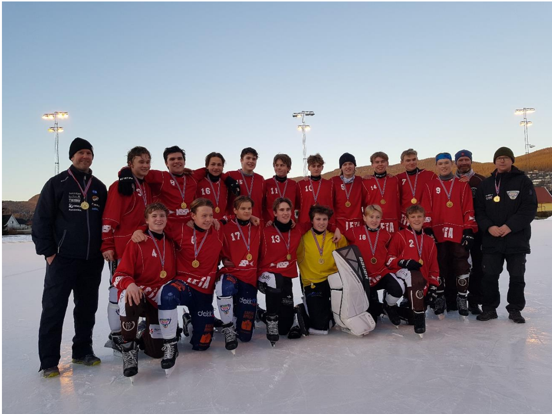
Vinner Krets- og lagsturnering Gutter 2003 2020 Buskerud.