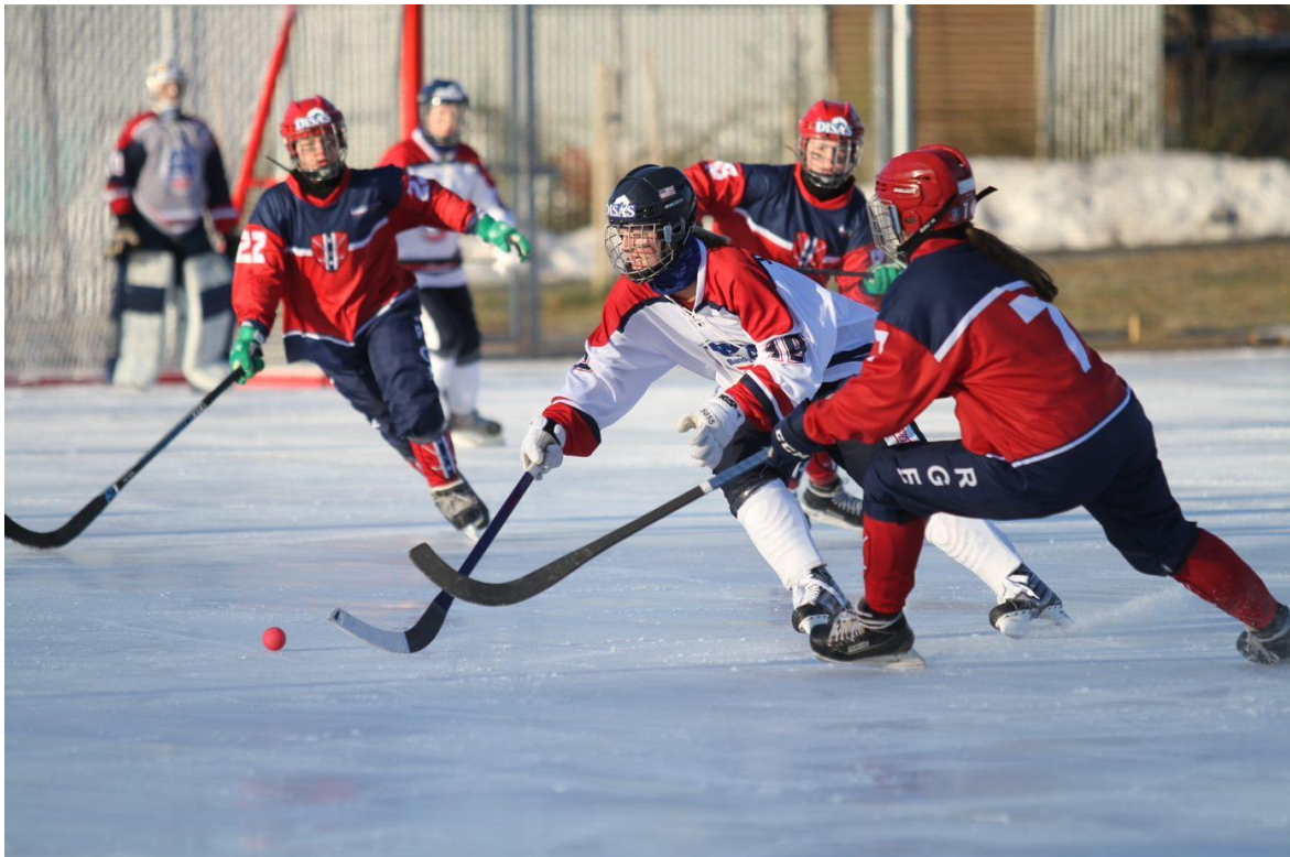
Norge-USA in action.