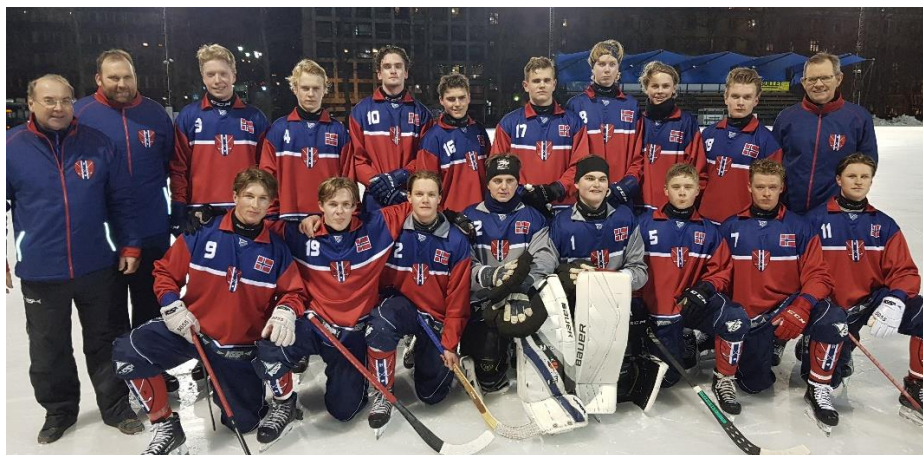
Norge U-19 under VM i Helsinki 2020.