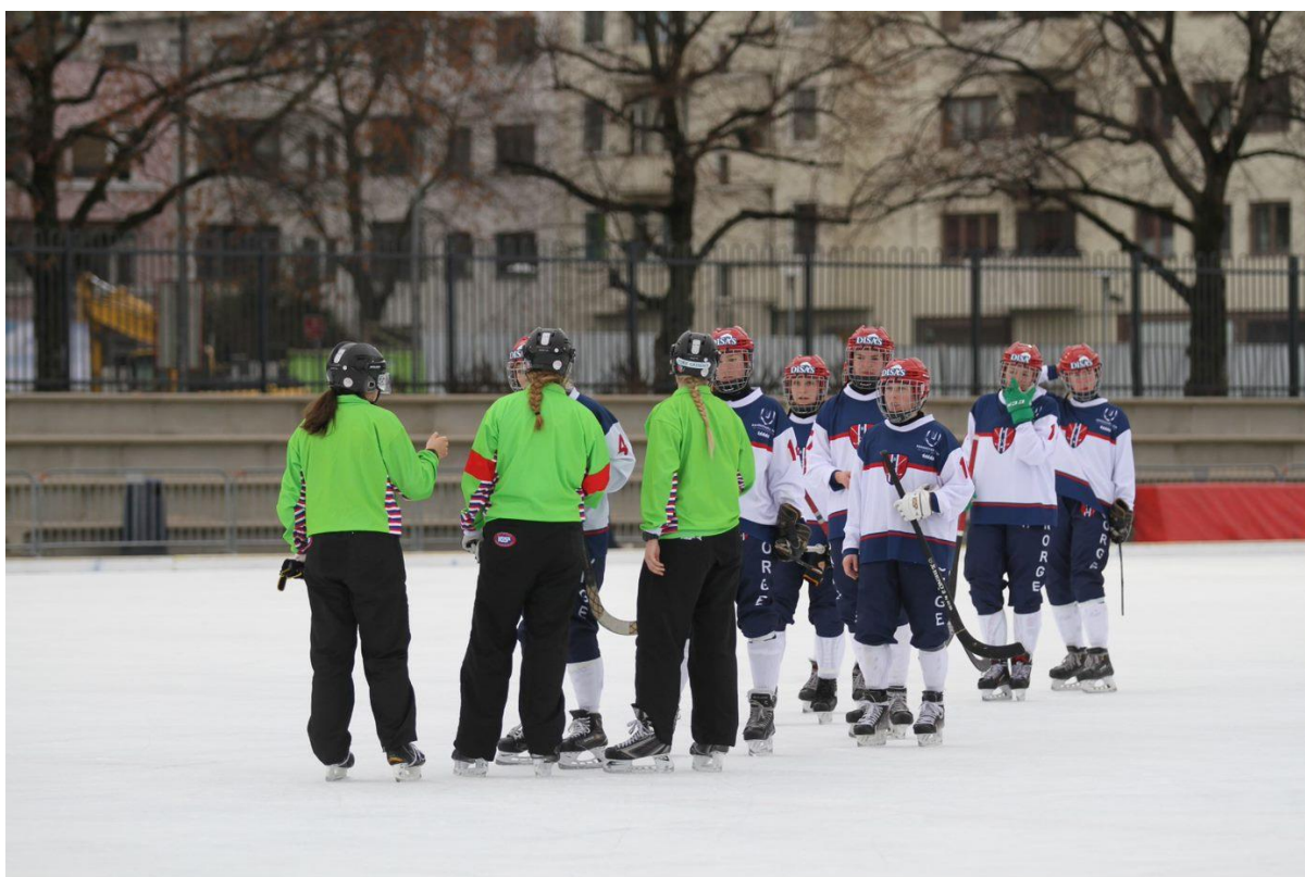
VM Damer 2020 i Oslo hadde kun kvinnelige dommere fra Russland, USA, Sverige og Norge.