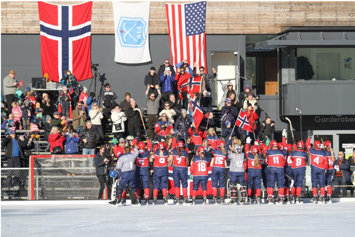
Norge spilte 1-1 i åpningskampen mot USA på Voldsløkka.