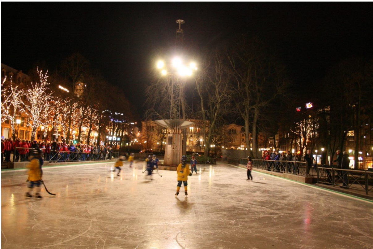
Jentekamp i Spikersuppa uner åpningen av VM Damer 2020.

Hvis seksjonens «egenkapital» er positiv kan seksjonen, med forbundsstyrets samtykke, disponere sin «egenkapital».