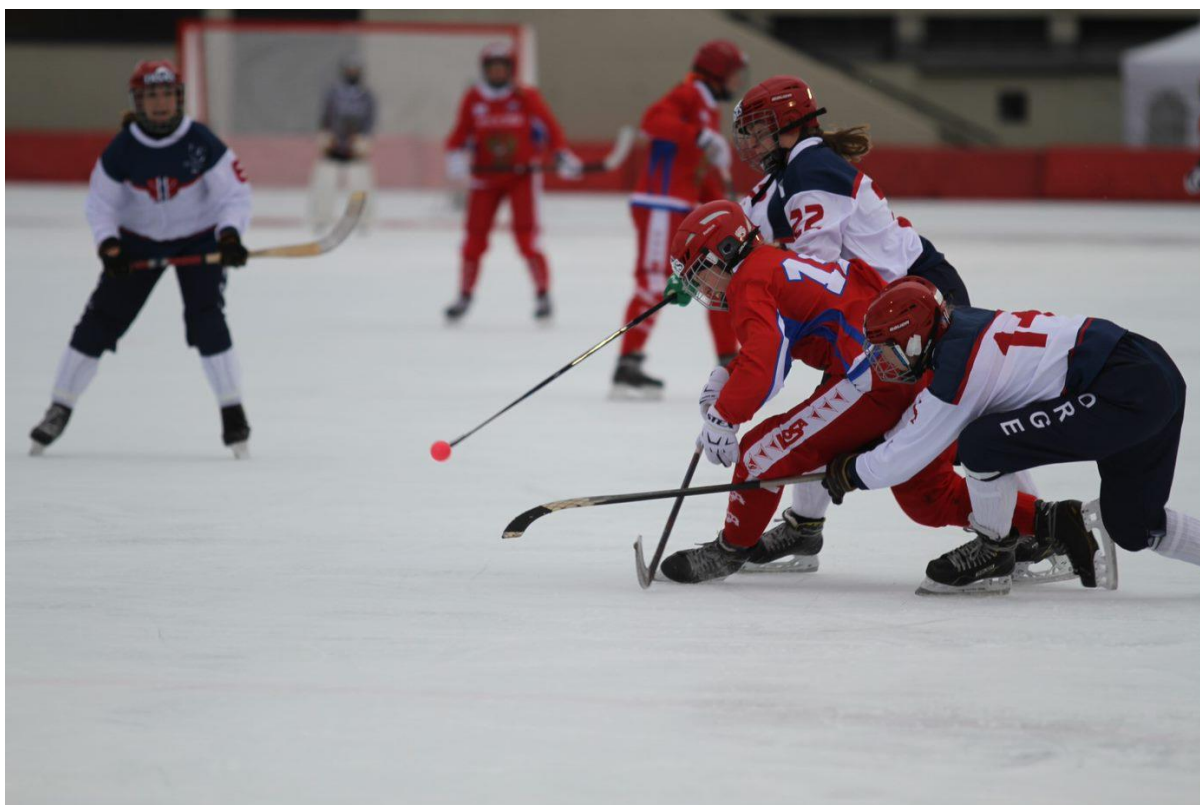
Norge tapte semifinalen mot Russland på Frogner Stadion 0-4.