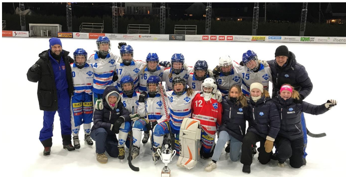
Vinner Dameserien 2019/20 - Høvik IF