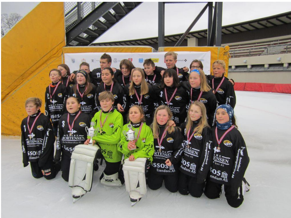
Solberg Skole vant både jenter- og guttefinalen i Barnekoleturneringen 2020.