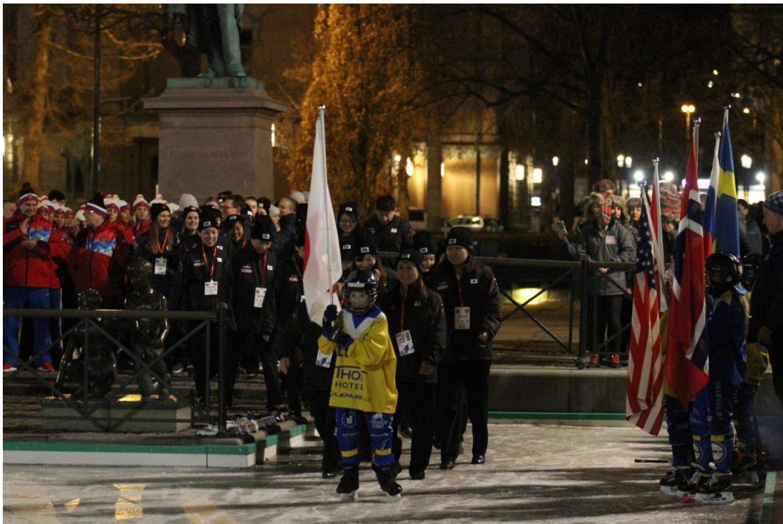
Åpningsseremonien VM Damer Spikersuppa tirsdag 18.februar 2020.

(s.) Stein Pedersen/Leder Bandyseksjonen