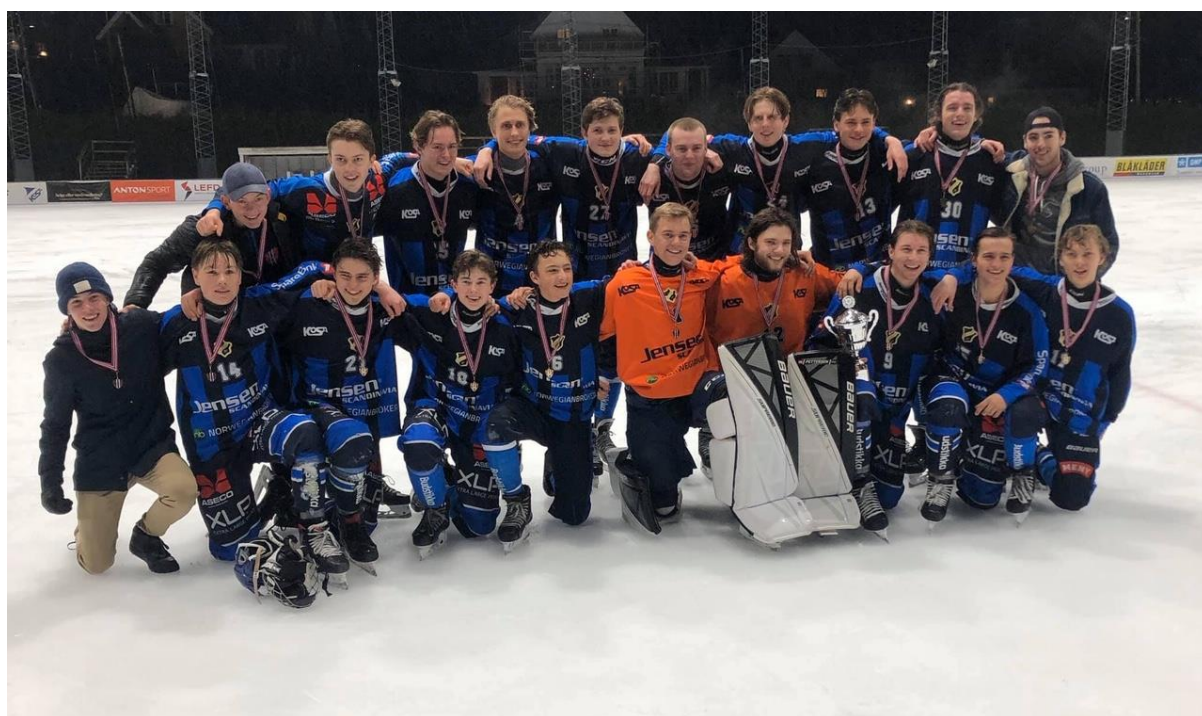
Norgesmester Junior 2020 – Stabæk IF